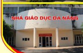
NHÀ GIÁO DỤC ĐA NĂNG