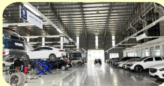
Thực hành nghề Công nghệ ô tô tại doanh nghiệp