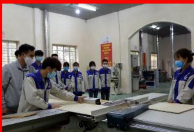
Giờ học thực hành nghề Gia công và TKSPM