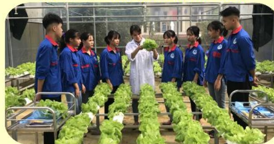
Thực hành nghề Nông nghiệp công nghệ cao