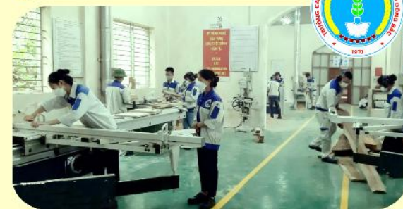
Thực hành nghề Gia công và thiết kế sản phẩm mộc