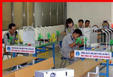
Giờ học thực hành nghề Điện công nghiệp