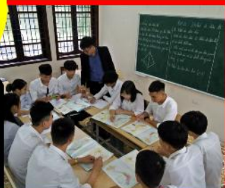
Giờ học văn hóa cấp THPT