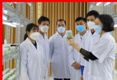
Giờ học thực hành nuôi cấy mô