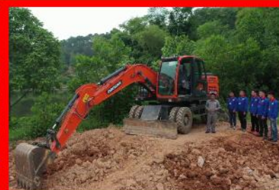
Giờ học thực hành vận hành máy xúc