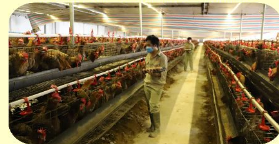
Thực hành nghề Chăn nuôi, thú y